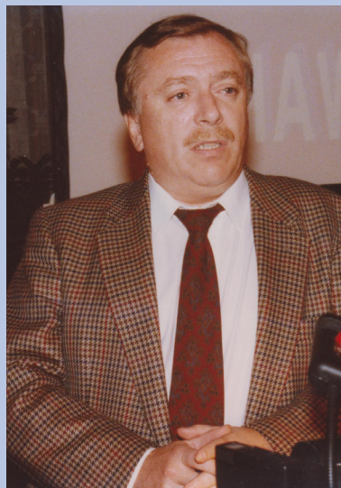
Ein wichtiger Förderer der IAWD war und ist Dr. Michael Häupl, der heutige Bürgermeister von Wien.

Die ersten Aktivitäten umfassten die Etablierung des Geschäftsbetriebes nach innen und außen, vor allem aber die Präsentation des TWB in den Wasserwerken der Länder des Donauraums und die Vorbereitung eines Programms zur regelmäßigen Untersuchung der Wasserqualität in den Flüssen. Mit Unterstützung der Budapester Wasserwerke wurden bereits in den Jahren 1996 und 1997 die ersten „IAWD-Donaubefahrungen“ durchgeführt; die nächste führte die Fachleute in den rumänischen Abschnitt der Donau. Die Auswertung der gesammelten Proben hatte von Anbeginn das „DVGW-Technologiezentrum Wasser“ (TZW) des „Deutschen Vereins des Gas- und Wasserfaches“ in Karlsruhe übernommen. Die IAWD-Donaubefahrungen wurden ab der erstmals 2001 durchgeführten „Joint Danube Survey“ der „Internationalen Kommission zum Schutz der